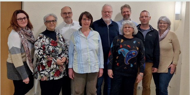
Das Team der Ökumenischen Woche 2026

Zum fünften Mal laden christliche Kirchen und Gemeinden Wetzlars zu einer ökumenischen Woche ein. Wir wollen Räume zur Begegnung öffnen, einander besser kennen lernen, gemeinsam auf Gott und sein Wort hören.